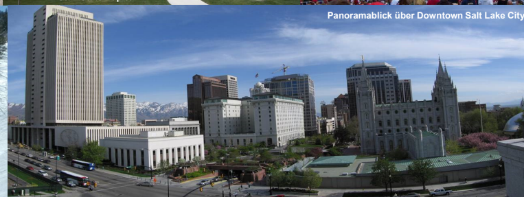
Panoramablick über Downtown Salt Lake City