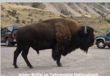
wilder Büffel im Yellowstone Nationalpark