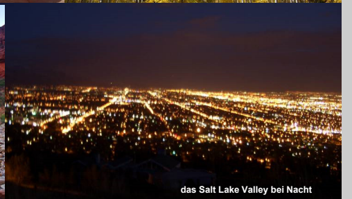
das Salt Lake Valley bei Nacht

Für weitere Auskünfte stehen zur Verfügung: