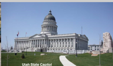
Utah State Capitol