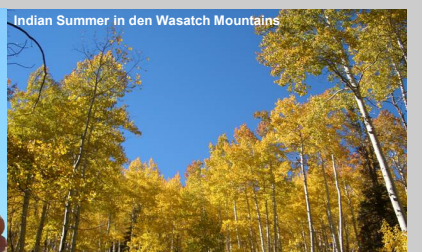
Indian Summer in den Wasatch Mountains