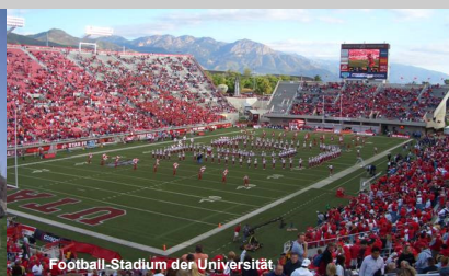
Football-Stadium der Universität