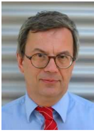
Von Rainer Wanninger

Professoren, Kenner des Bologna-Unwesens und Akkreditierungsspezialisten sind mit dem Begriff vertraut: Berufsbefähigung. Damit soll gemeint sein, dass Absolventen eines Bachelorstudiums von 6 Semestern Dauer, also nach einer "Workload" (jaja, so heißt das) von 5.400 Arbeitsstunden zu einem "Beruf" befähigt sein sollen. Vielleicht hätte man besser sagen sollen "zu einer bezahlten Tätigkeit" oder "zu einem Broterwerb". Warum auch nicht; in einem klassischen Ausbildungsberuf reichen ja drei Ausbildungsjahre schließlich auch. Und warum sollen Ingenieure eigentlich intensiver und zeitaufwendiger ausgebildet werden als unsere Azubis? Soweit mit nur minimalem Sarkasmus zum Thema Bologna und Studienreform.