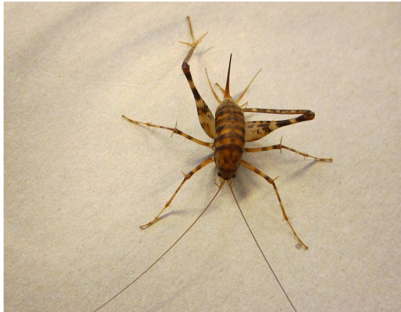
Abb. 18: Gewächshausschrecke Tachycines asynamorus im Versuchshaus (warm). 5.12.2012.