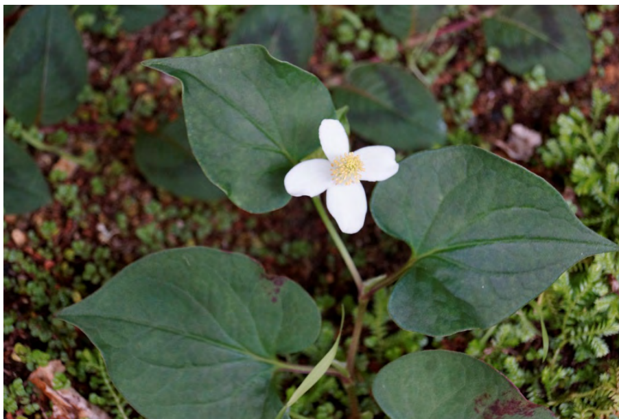
Abb. 11: Houttuynia cordata im Versuchshaus (kalt). 12.9.2013.

Anmerkung: Verwilderungen bereits gelegentlich in Privatgärten im Braunschweiger Raum.