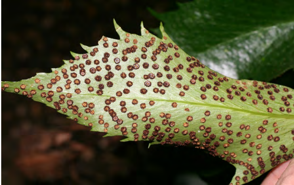
Abb. 3: Cyrtomium falcatum cv. 'Rochfordianum'. 14.6.2012.