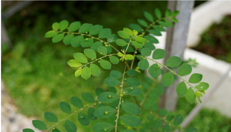
Abb. 4: Andrachne phyllanthoides im Versuchshaus (kalt). 12.9.2013.