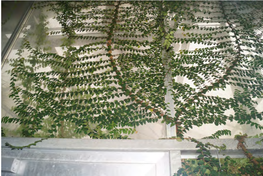
Abb. 8: Ficus pumila . Tropenhaus, 12.9.2013.