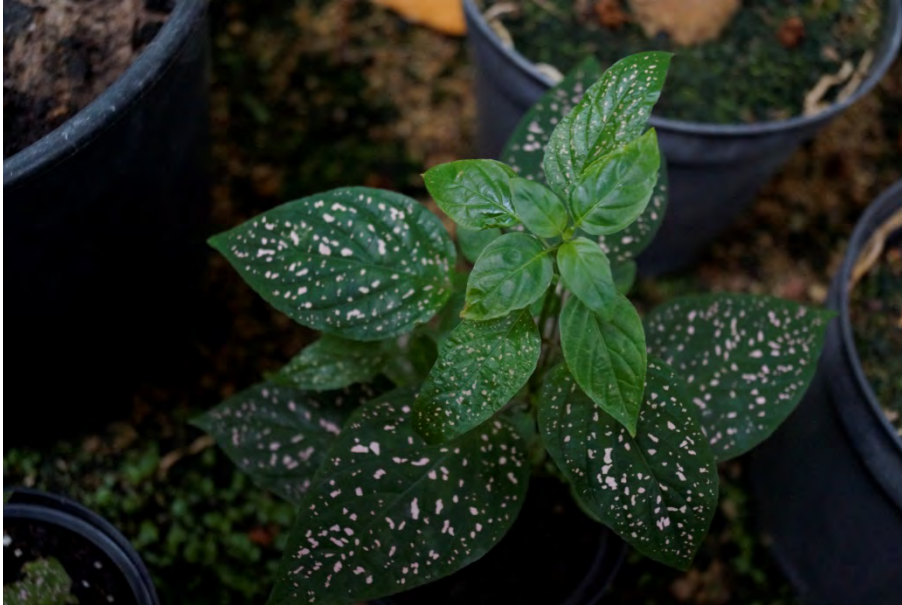
Abb. 12: Hypoestes phyllostachya im Versuchshaus (warm). 26.9.2013.