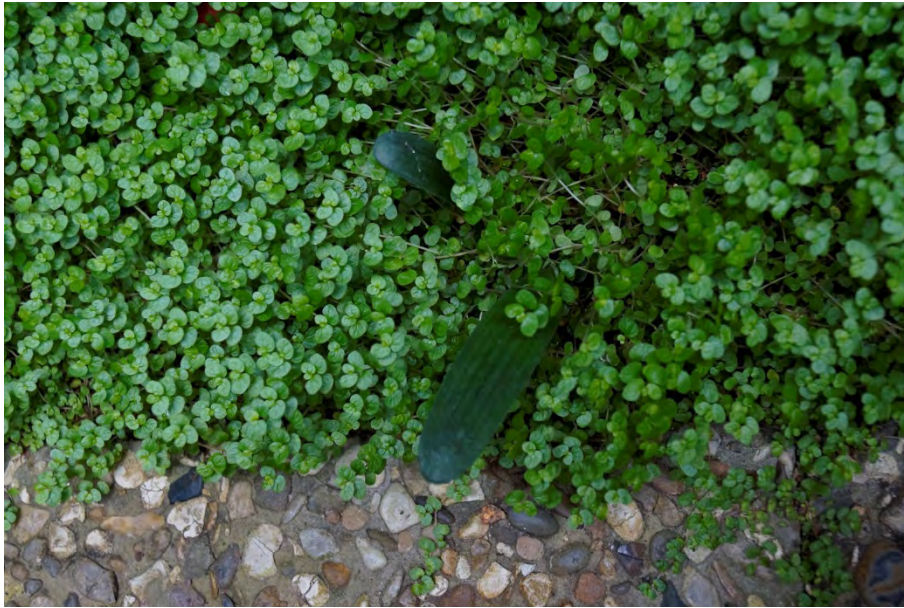
Abb.7: Clivia miniata (Jungpflanze) im Bestand von Soleirolia soleirolii . Versuchshaus (kalt), 26.9.2013.