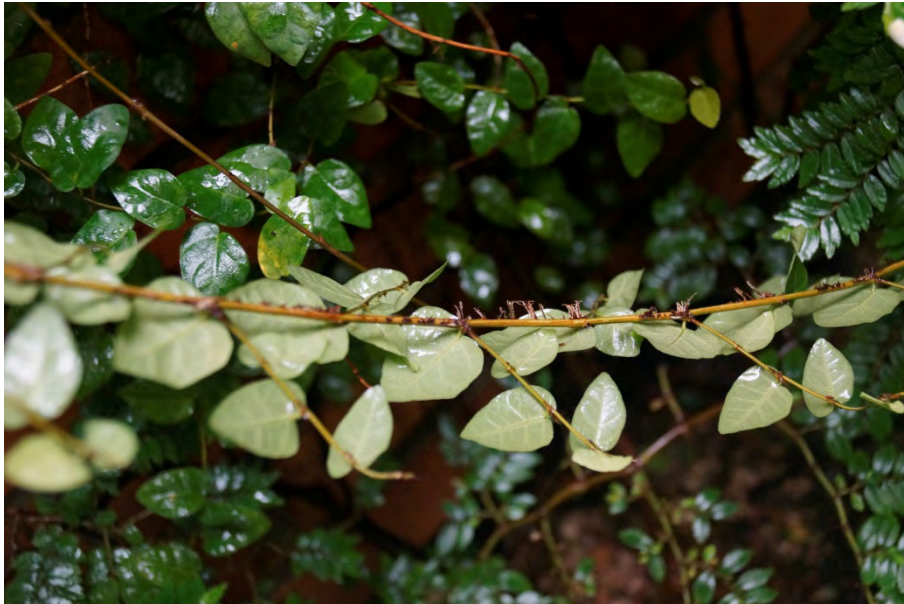
Abb.9: Ficus pumila : sproßbürtige Wurzeln. Tropenhaus, 12.9.2013.