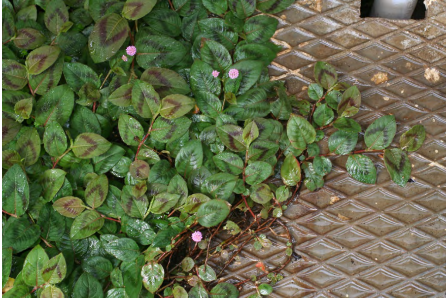
Abb. 13: Persicaria capitata im Versuchshaus (kalt). 20.6.2011.