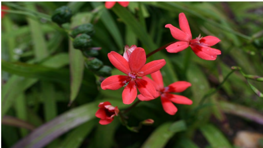
Abb. 5: Anomatheca laxa im Versuchshaus (kalt). 14.6.2012.

Primäres Areal: Südliches Afrika, Mozambique.