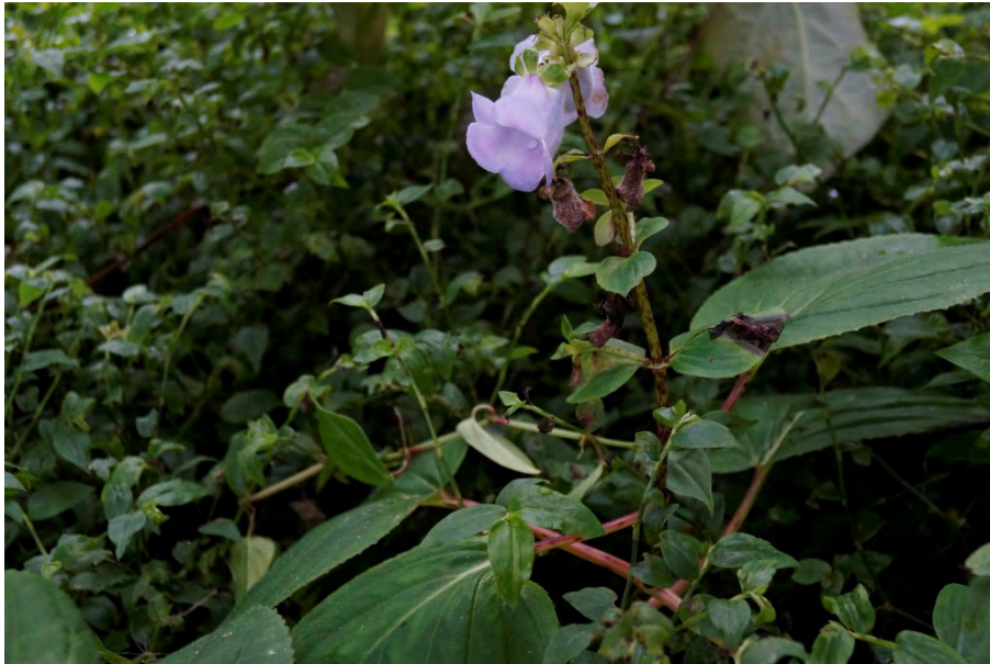
Abb. 10: Gloxinia perennis im Bromelien- und Orchideenhaus. 26.9.2013.