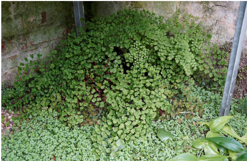
Abb.1: Adiantum capillus-veneris , Soleirolia soleirolii und Tradescantia fluminensis im Versuchshaus (kalt) unter den Arbeitstischen (Gitterroste). 12.9.2013.