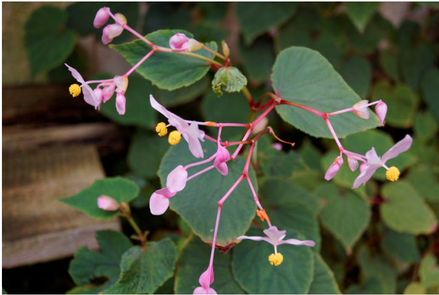
Abb. 6: Begonia grandis subsp. evansiana im Versuchshaus (kalt). 12.9.2013.