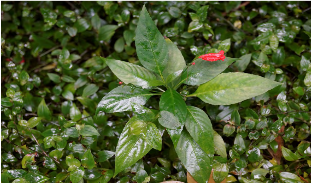
Abb. 16: Ruellia brevifolia im Orchideen- und Bromelienhaus. 16.9.2013.