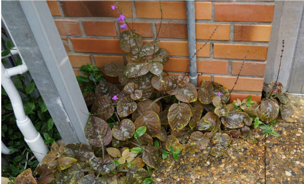
Abb. 15: Pseuderanthemum alatum im Orchideen- und Bromelienhaus. 12.9.2013.

Primäres Areal: Mexiko, Zentral-Amerika.