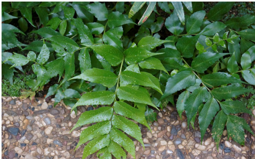
Abb. 2: Cyrtomium falcatum . Versuchshaus (kalt). 12.9.2013.

Anmerkung: Cyrtomium falcatum verwildert in subtropischen Regionen, so z. B. auf La Palma, aber auch gelegentlich und unbeständig in Mitteleuropa, so z. B. in Bochum (Bochumer Botanischer Verein 2011: var. clivicola ). Ein Kulturversuch in einem Garten führte in Ostniedersachsen jedoch nach einer starken Frostperiode bereits im ersten Winter zum Totalausfall.