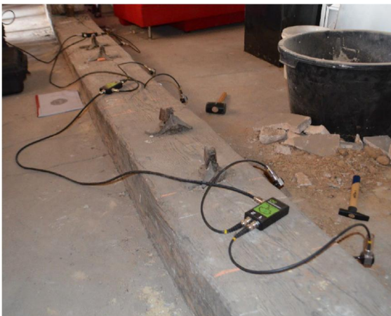
Messung an einem ca. 400 Jahre alten Überzug im Prizenpalais Wolfenbüttel (iBHolz)

Im Rahmen einer studentischen Arbeit können theoretische Grundlagen zu dem Messverfahren und beeinflussende Parameter erarbeitet werden. Die Untersuchungen ausgewählter Einflüsse, wie zum Beispiel der Feuchtegehalt des Holzes oder die Spannungszustände im Bauteil während der Messung, können durch einen experimentellen Teil der Arbeit ermöglicht werden.