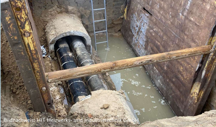
Baugrube im Dezember 2021 mit Leckagewasser aus der Fernwärmetrasse