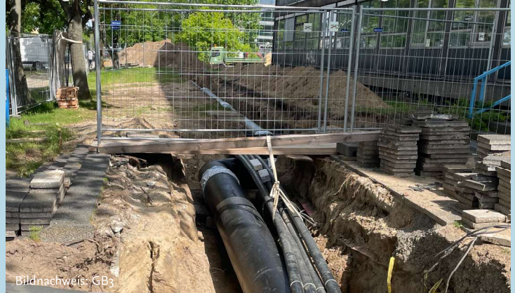
Verlegung neuer Fernwärmerohrleitungen