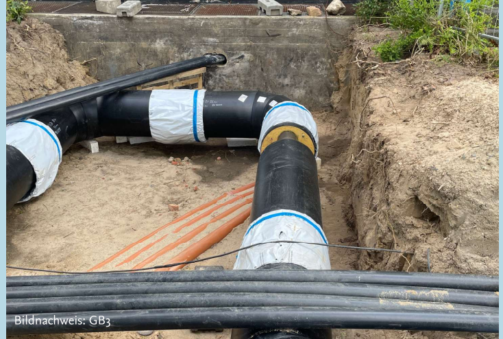
Verlegung neuer Fernwärmerohrleitungen