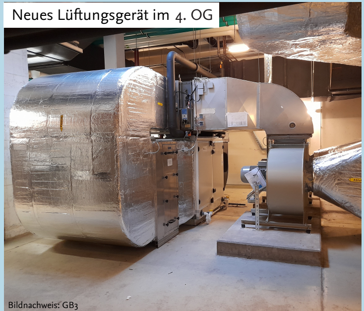
Neues Lüftungsgerät im 4. OG