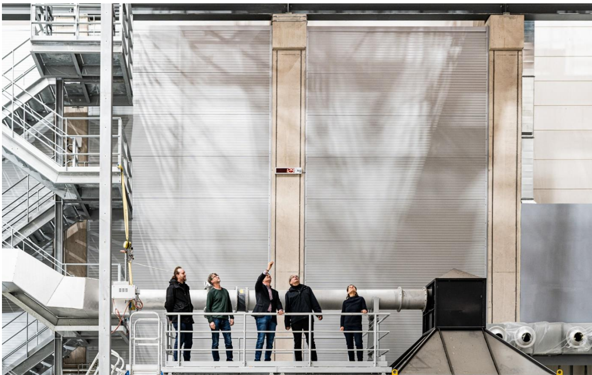
Abbildung: Baustelle ZeBra, März 2023