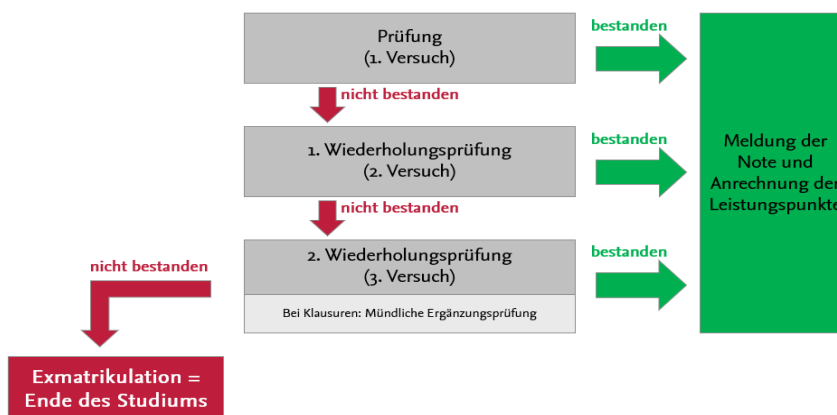
Darstellung Prüfungsversuche bei Prüfungsleistungen

Prüfungsleistungen sind benotete Leistungen und gehen in die Berechnung der Gesamtnote ein. Die Note erscheint auf dem Zeugnis. Wenn Sie eine Prüfungsleistung nicht bestehen, müssen Sie diese wiederholen. Alle nicht bestandenen Prüfungsleistungen können zweimal wiederholt werden. Sollte auch der dritte Versuch und ggf. die mündliche Ergänzungsprüfung (Achtung: nur bei Klausuren) nicht zum Bestehen führen, erfolgt die Exmatrikulation und Sie können das Studium nicht weiterführen.