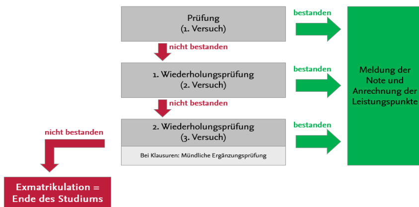
Darstellung Prüfungsversuche bei Prüfungsleistungen

Prüfungsleistungen sind benotete Leistungen und gehen in die Berechnung der Gesamtnote ein. Die Note erscheint auf dem Zeugnis. Wenn Sie eine Prüfungsleistung nicht bestehen, müssen Sie diese wiederholen. Alle nicht bestandenen Prüfungsleistungen können zweimal wiederholt werden. Sollte auch der dritte Versuch und ggf. die mündliche Ergänzungsprüfung (Achtung: nur bei Klausuren) nicht zum Bestehen führen, erfolgt die Exmatrikulation und Sie können das Studium nicht weiterführen.