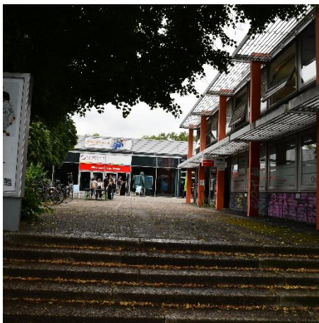
Zugang zum AStA (rechts) und Mensa 1 (geradeaus)

Falls Sie zum Allgemeine Studierendenausschuss (AStA) oder der Mensa 1 , dem 360° bzw. der 9bar wollen, gehen Sie vom Haus der Wissenschaft Richtung Hamburger Straße, entweder entlang der Straße oder durch den kleinen Park, bei dem es sich bei genauerer Betrachtung um einen Garnisonsfriedhof handelt.