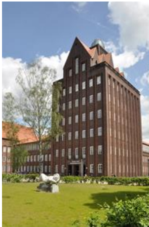
Haus der Wissenschaft

Für Verwaltungsangelegenheiten müssen Sie zum Hauptcampus in die Pockelsstraße fahren oder gehen. Dort finden Sie, wenn Sie durch den Haupteingang im Haus der Wissenschaft gehen, im Erdgeschoss auf der linken Seite das Studienservice-Center der Universität. Sie finden dort während der Servicezeiten Ansprechpersonen aus verschiedenen Beratungseinrichtungen (Immatrikulationsamt, International House, Zentrale Studienberatung, Students@work, Agentur für Arbeit, Sozialberatung & Hochschulsportzentrum). Dort erhalten Sie auch das Willkommens-Paket .