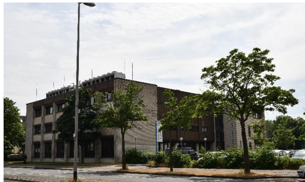
Gauß-IT Zentrum, Hans-Sommer-Str. 65, 38106 Braunschweig

Seit dem Wintersemester 2020/21 bekommen Erstsemesterstudierende (Bachelor, Master, Staatsexamen) einmalig je 20,00 EUR auf Ihr Druckkonto gutgeschrieben. Dieses Guthaben behält bis zum Studienende seine Gültigkeit. Nicht verbrauchte Zuschuss-Druckguthaben verfallen am Studienende.