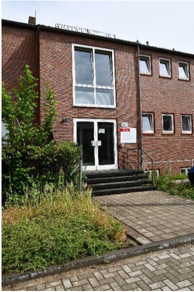
Eingang zur Geschäftsstelle der Fakultät