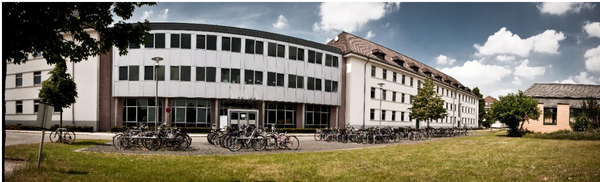
Department Sozialwissenschaften, Bienroder Weg 97, 38106 Braunschweig

Mit öffentlichen Verkehrsmitteln erreichen Sie den Campus Nord über die Haltestellen Siegfriedstraße (Tram 2) bzw. Siegfriedstraße oder Freyastraße (Bus 416, 436 oder 426). Für Fahrräder und Autos stehen auf dem Campus ausreichend Parkplätze zur Verfügung.