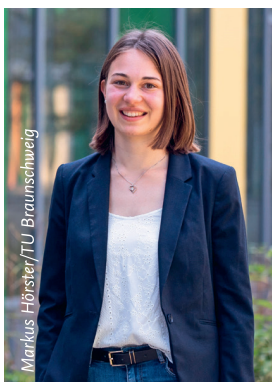
Markus Heister/TU Braunschweig

Catherine Rau, Luft- und Raumfahrttechnik