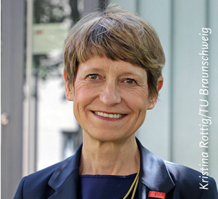
Kristina Rottig/TU Braunschweig

„Vom Deutschlandstipendium profitieren alle Seiten: Förderer*innen erhalten durch den regelmäßigen Kontakt zu Stipendiat*innen und Universitätsangestellten sowohl wertvolle Einblicke in das