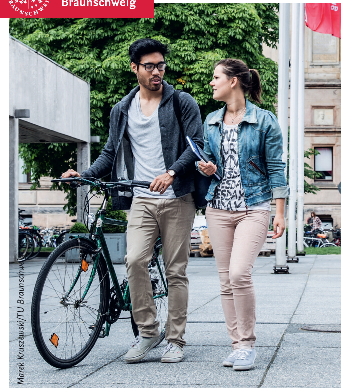
Marek Kruszewski/TU Braunschweig

www.deutschlandstipendium.de www.tu-braunschweig.de/stipendien